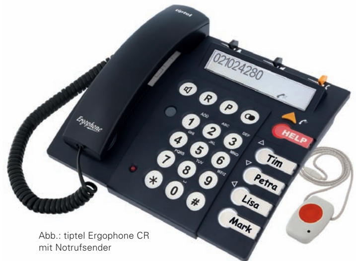
Abb.: tiptel Ergophone CR mit Notrufsender